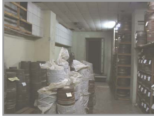
Foto Nro.2: Depósito Patrimonial-"Sucesos Argentinos"- Circulaciones usurpadas