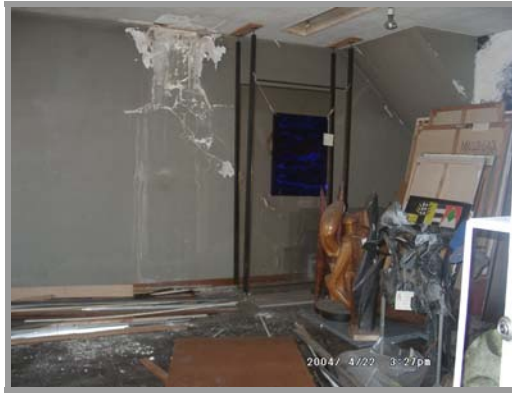
Foto Nro. 1: Vista interior del depósito del 9no.Piso de Teatro San Martín