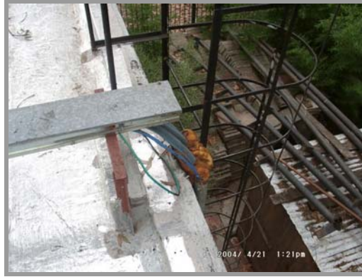
Foto Nro. 1: Vista Cables de alimentación Equipos de Aire Acondicionado