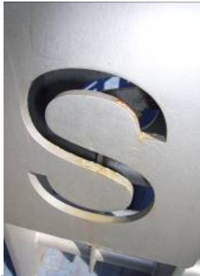
Acceso a Estación Caseros