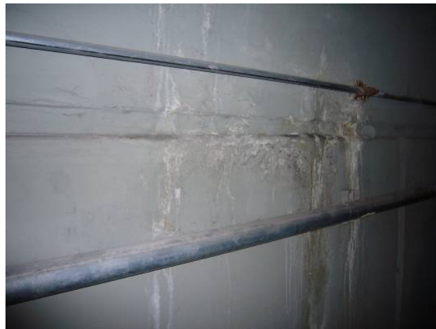
Túnel entre Estación Caseros y Taller Colonia